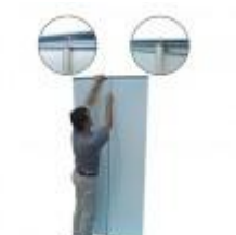
De veerkrachtige stok zorgt voor een strak en stevig staande banner