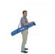
Het bannersysteem in een draagtas