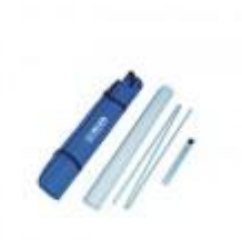
De opgerolde banner en de onderdelen van het frame