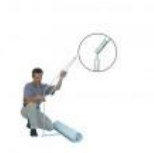
De veerkrachtige stok tussen de voet en de top van de banner